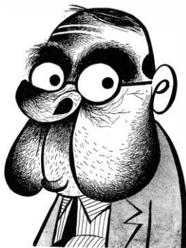
Fig. 01. Caricatura de Nereu Ramos, um dos idealizadores da Constituição de 1937. Vice-presidente do Brasil, eleito pelo Congresso Nacional, de 1946 a 1951. Foi presidente da República durante dois meses e 21 dias, de 11 de novembro de 1955 a 31 de janeiro de 1956.

Aponta-se o erro judiciário como um ponto norteador do caso dos irmãos Naves e de suas consequências. Contudo, é importante afirmar que o presente artigo irá nortear-se através de um caso de latrocínio que teria ocorrido na pacata cidade de Araguari, interior de Minas Gerais, durante o Estado Novo de Getúlio Vargas, em 30 de novembro de 1937 tendo sido considerado pela imprensa, como também pela Justiça, posteriormente, como um dos casos mais célebres de injustiça e erro judiciário de nosso país.